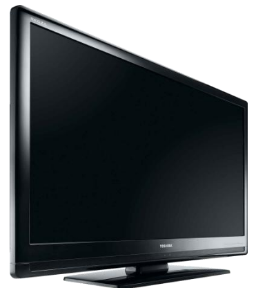
Abb. kann abweichen

*) Alle Preise verstehen sich zzgl. der gesetzl. MwSt. Diese Aktion ist bis zum 31.12.2010 befristet und setzt einen Wartungsvertrag mit einer Mindestlaufzeit von 24 Monaten voraus. Irrtum vorbehalten.